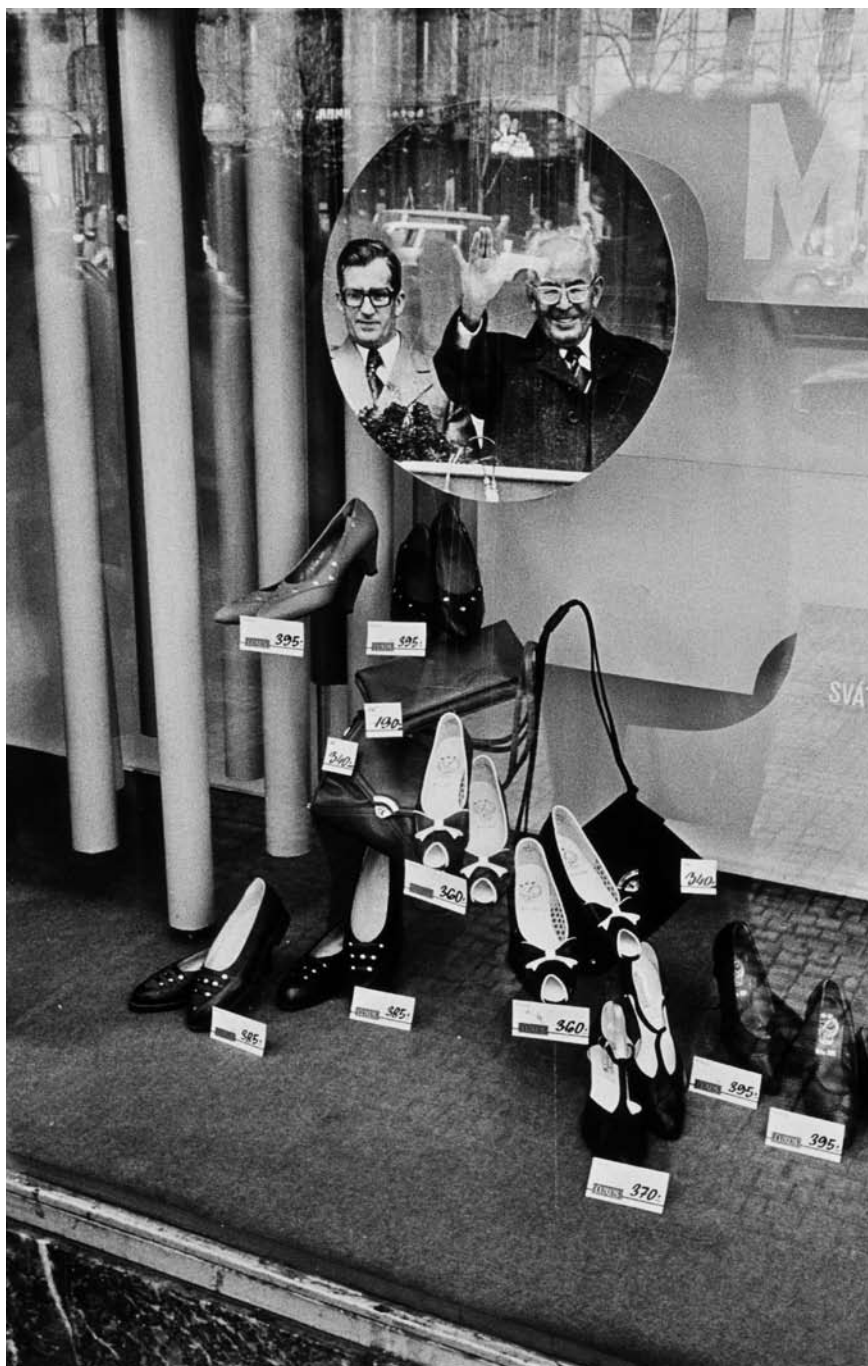
Předseda federální vlády Lubomír Štrougal a prezident republiky Gustáv Husák ve výloze Domu obuvi na Václavském náměstí. Praha, 1984